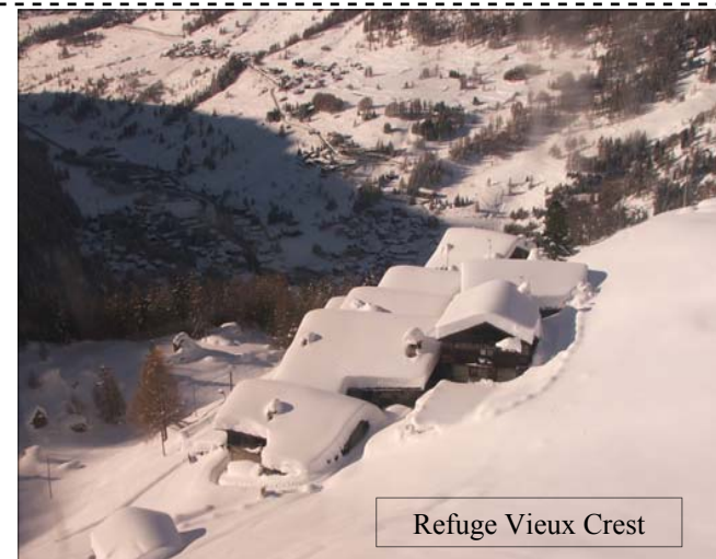
Refuge Vieux Crest

Den fyldestgørende version: Steen havde gjort et meget stort opsøgende arbejde forud for turen, og havde gennem SlopeTrotter Skitours fundet et utroligt hyggeligt refugie oppe i terrænet i Champoluc. Champoluc ligger i Monte Rosa bjergmassivet i Val d’Aosta, og massivet har helt korrekt fået navn efter bjergenes farve ved solopgang og solnedgang. ”Refuge Vieux Crest” betyder noget i retning af: ”Den gamle knaldhytte på bjergryggen”. Refugiet lå med en fantastisk udsigt ud over de snedækkede bjerge, og