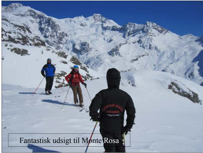
Fantastisk udsigt til Monte Rosa

men det taler da til brødrenes fordel, at den ikke lå over mit hoved.