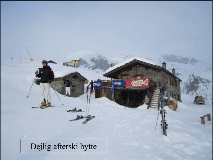
Dejlig afterski hytte

Afterski har altid haft en kultagtig status i Glostrup Skiclub. I Champoluc gennemføres den efter et noget specielt koncept, hvor en skigendarm og skipatroljen lukker sidste bjerghytte præcis kl. 1645, så folk kan komme sikkert ned fra bjerget. Et koncept der var værd at overveje andre steder i alperne, hvor berusede skiløbere er til fare for sig selv og andre. Det er jo ikke nogen skam at gå